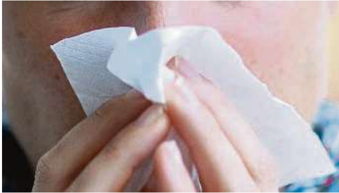
Wenn Schnupfen und Husten grassieren, sollte man einige Ratschläge befolgen.

Region – Wie das Amt für Gesundheit und Gefahrenabwehr des Main-Kinzig-Kreises mitteilt, können bestimmte Verhaltensregeln bei akuten Atemwegserkrankungen hilfreich sein, um die Verbreitung von Krankheitserregern zu reduzieren. Hinweise auf eine mögliche Infektion sind häufig Symptome wie Halsschmerzen, Husten, Schnupfen, Kopfschmerzen, allgemeine Schwäche, Unwohlsein, Muskelschmerzen oder Fieber. Die Übertragung der Erreger erfolgt meist durch Tröpfchen, welche beim Atmen, Husten