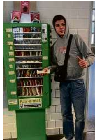
Bei den Beruflichen Schulen Gelnhausen hat der Fair-O-Mat seinen Betrieb aufgenommen.

Die Produkte des Fair-O-Mats stammen aus dem Weltladen. Dank der großzügigen Unterstützung des Lions Club Main-Kinzig Barbarossa konnten diese finanziert und der Automat somit befüllt werden. Die Unterstützung des Lions Club ermöglicht es, die Aktivitäten weiter