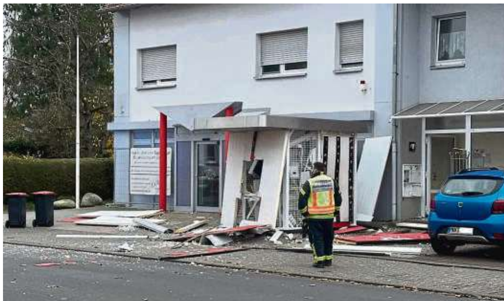
Ein Bild der Verwüstung: Vermutlich drei Täter sprengen am frühen Morgen einen Geldautomaten in Hasselroth und flüchten dann nach Schöllkrippen.

Bei den Festgenommenen handelt es sich um drei Männer aus den Niederlanden im Alter von 19 bis 24 Jahren. Sie stehen im Verdacht, den Geldautomaten mit Sprengstoff gesprengt sowie den Geldbetrag aus den Automaten erbeutet zu haben. Anschließend sind sie mit einem „gestohlenen hochmotorisierten