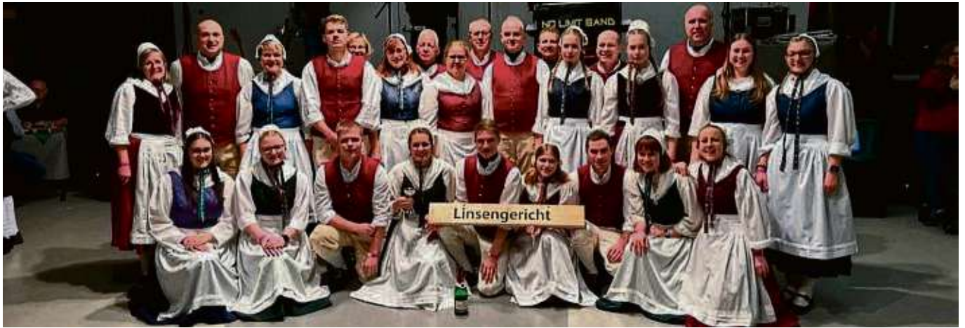
Lieferte sich mit der Landjugend Haubern ein Kopf-an-Kopf-Rennen um die Hessenkrone in der Kategorie Mehrpaarkreis: die Folkloregruppe Linsengericht.

Schon am Morgen war die Spannung nach dem Pflichttanz der Mehrpaarkreise der „Kreuzpolka“ auf dem Höhepunkt. Lediglich ein Punkt Vorsprung trennte die Landjugend Haubern von den Linsenge-