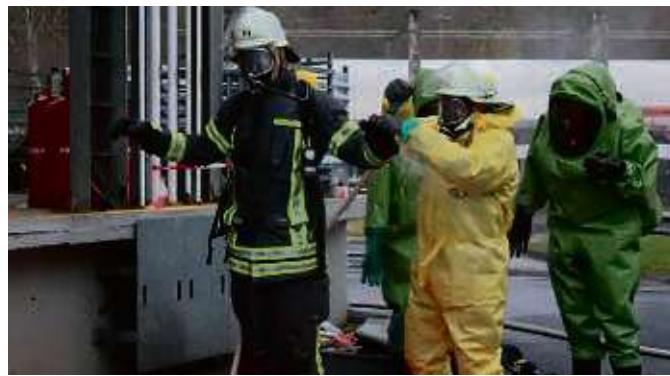
Selten sind die Einsätze für ABC-Spezialeinheiten der Feuerwehr, umso wichtiger sind für sie daher Übungen wie diese in Schlüchtern.