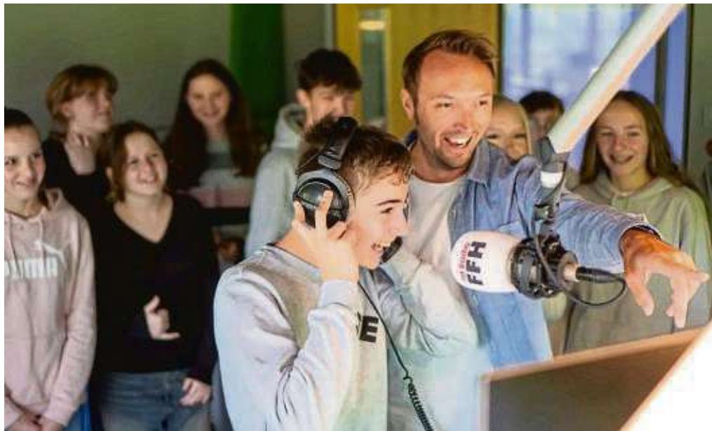
Die Klassen G9f und R9f der Kopernikusschule Freigericht hatten viel Spaß beim spannenden Tag im FFH-Hörfunkstudio in Bad Vilbel.