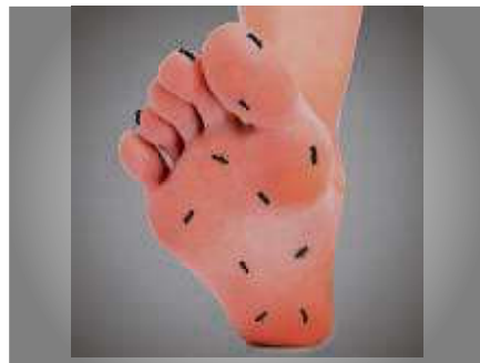
Kribbelnde Füße infolge von Nervenschmerzen?