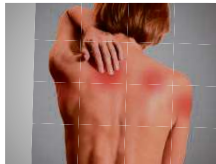
Nervenbedingte, muskelerartige Schmerzen?

Mehr als 23 Millionen Deutsche klagen heutzutage über chronische Schmerzen. Besonders häufig sind Nacken- oder Rückenschmerzen, die sogar bis in die Beine ausstrahlen können. Andere haben Schmerzen in Beinen oder Füßen, die von Missempfindungen wie Brennen, Kribbeln oder Taubheitsgefühlen begleitet werden können. Wieder andere kämpfen mit mysteriösen muskelerartigen Schmerzen am ganzen Körper. Und auch wenn es so scheint, als würden die Betroffenen unter völlig verschiedenen Beschwerdebildern leiden, so steckt doch meist derselbe Auslöser dahinter: geschädigte oder gereizte Nerven!