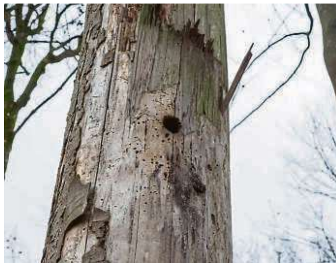
Dieser Biotopbaum bietet Lebensraum für zahlreiche Waldbewohner, etwa einen Specht.

„Für viele ist das ein Widerspruch: Naturschutz, Holznutzung und Brennholz“, erklärt der Förster. „Aber in unserem Wald sind Naturwald-Strukturen fest eingebunden.“ Tote, umgestürzte und gesunde Bäume in unterschiedlichem Alter, berichtet Betz, stehen alle in direkter Nachbarschaft im Wald. Im Rahmen der ökologischen Waldwirtschaft sei das kein Widerspruch. Auch Naturverjüngung gehört zu seinen Aufgabenfeldern. Dabei werde, erklärt Betz, der Wald mit Samen der vorkommenden Bäume verjüngt, zusätzlich werden auch klimastabile Arten gepflanzt. „Durch diese Maßnahmen haben wir eine riesige Strukturvielfalt bekommen“, betont der 64-Jährige. Und die Nutzung finde im Einklang mit der Natur statt. „Wir schaffen auf natürliche Art und Weise einen tollen Lebensraum und ernten einen einzigartigen Rohstoff: Holz.“