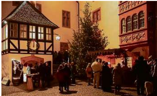
Tavernen, Händler, Handwerker, Gaukler, Magier und Musiker lassen das Mittelalter in weihnachtlicher Atmosphäre auf der Burg wieder aufleben.

nell um 12 Uhr durch Herold Johann vom Bärensee eröffnet und bietet im Anschluss ein abwechslungsreiches Programm, welches von dem Veranstalter, dem Burgmuseum Ronneburg – Freunde der Ronneburg, zusammengestellt wurde. Neben Kindertheater, Feuerartistik und dem Nikolaus, der kleine Geschenke an die jüngsten Besucher verteilt, wird ein besonderes Highlight das fröhliche „Krippenspiel-Theater“ auf der Hauptbühne sein: Mit viel Witz und Humor erzählen die „echten“ Protagonisten, wie es damals wirklich mit der Geburt Jesu und der verrückten Volkszählung abließ. Die Besucher können zusammen mit Maria und Josef, dem Engel und den Heiligen Drei Königen das große Fest der Freude feiern und den Ursprung des christlichen Weihnachtsfests mitten auf dem großen Marktplatz vor der Burg, jeweils um 17 Uhr, erleben. Zum Abschluss jedes Markttags wird es vor der Marktplatzbühne wieder eine imposante Feuershow geben. Der Veranstalter weist nachdrücklich auf die Möglichkeiten der Anfahrt und die Parkplatzsituation hin,