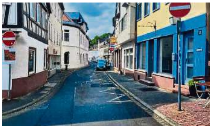
So sieht die Röther Gasse heute aus...

Die Kinos würden zu einer städtebaulichen Einheit durch einen verbindenden „Roten Teppich“ im Asphalt. az