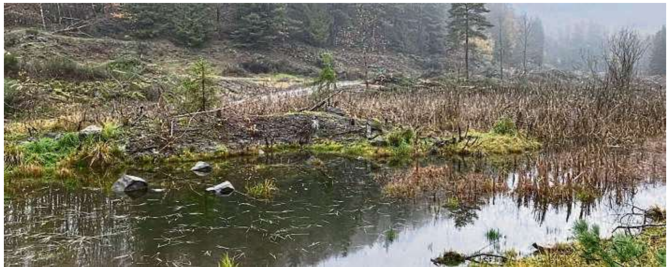
Viele Arten fühlen sich hier wohl: das Biotop im Westbruch Gelnhausen.