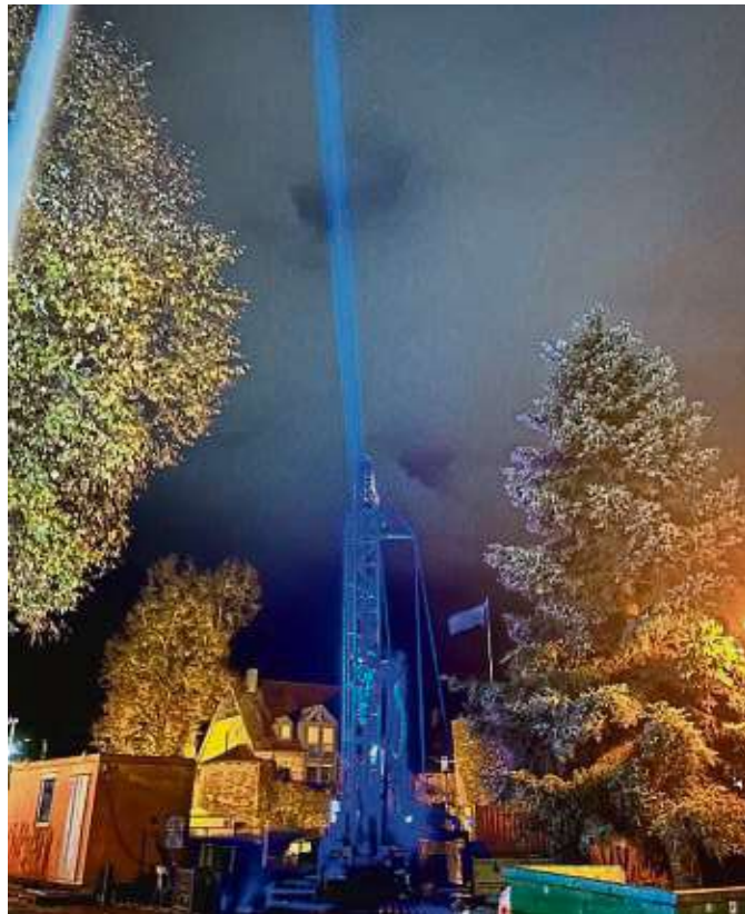
Symbol für eine „leuchtende Zukunft“: Der Bohrturm wurde feierlich in blau angestrahlt.

Am 6. September startete die Kurstadt die Bohrung am Untertor, in Richtung der unterirdischen Soleader. Die neue Förderquelle soll die alten in Zukunft ersetzen. Ein von der Kurstadt beauftragter Hydrologe hatte die Ader entdeckt, die ihren Ursprung im Kaliberg bei Flie-