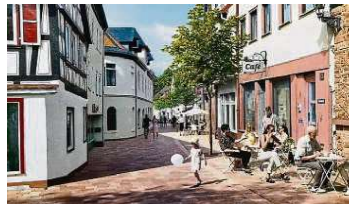
... und das soll einmal aus ihr werden.