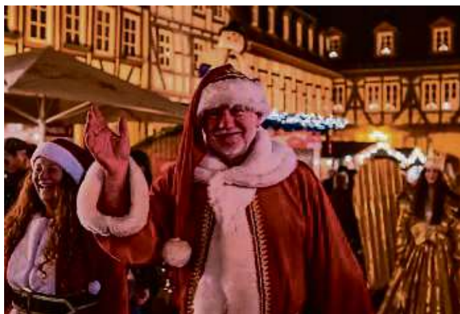
Die Besucherinnen und Besucher des Weihnachtsmarktes werden natürlich auch dem Nikolaus und seinen Weihnachtsfrauen begegnen.

Das Christkind mit seinen himmlischen Heerscharen, Weihnachtskugeln mit Botschaften, Wichtel auf der Suche nach Verstärkung, ein haushoher Adventskalender, Ziegen, die eine Kutsche ziehen: In der Weihnachtsstadt Gelnhausen ist in der Vorweihnachtszeit wieder (fast) alles möglich.