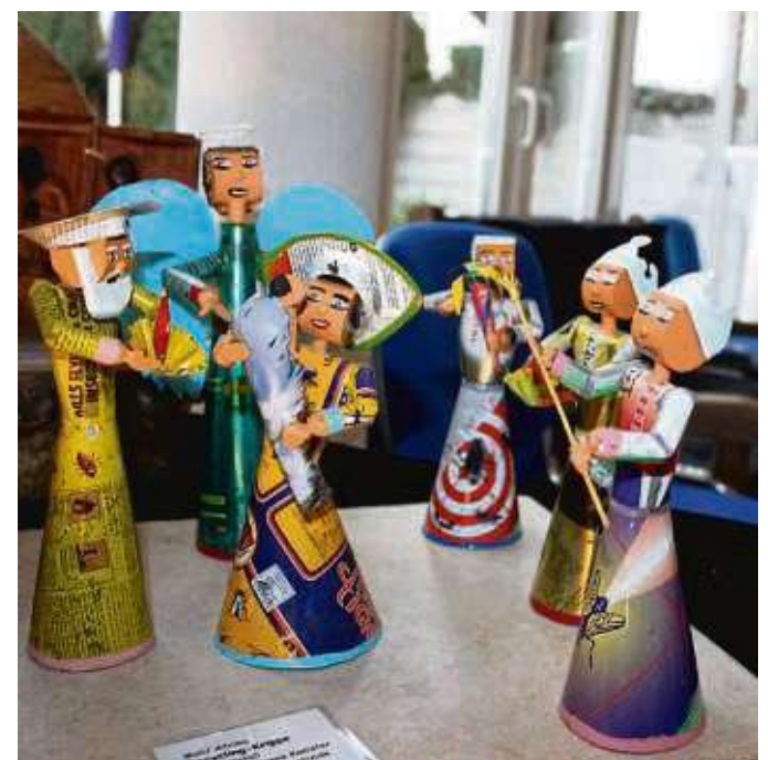
Eine Recycle-Krippe aus bunten, gedrehten Papierstreifen veranschaulicht die Vielfältigkeit des Museums.

Wer die Krippensammlung in der Steinstraße 34 in Nidda-Ulfa anschauen möchte, kann dies bis 31. Dezember, tun. Geöffnet ist die Ausstellung donnerstags bis sonntags von 15 bis 18 Uhr, am 25. und 26. Dezember von 14 bis 18 Uhr, am 24. Dezember ist geschlossen. Infos im Internet unter www.weihnachtskrippen-museum.de .