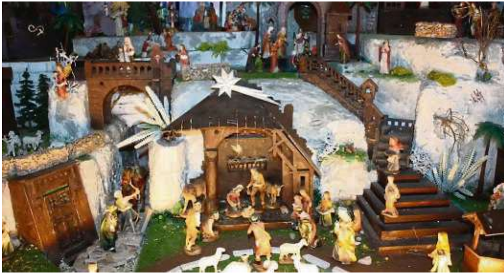
Krippen aus aller Herren Länder: Rund 300 Exemplare haben sich im Lauf der Jahre im privaten Museum angesammelt.

Zunächst legte sie sich eine private Sammlung zu, die neben Darstellungen aus Südtirol und dem Herrgottswinkel bald ergänzt wurde durch Exemplare aus dem Böhmer-