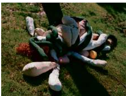
Janaina Tschäpe, „Ovaria“ SOS-Edition 2011, Auflage: 20+3, nummeriert und signiert, Digitaler c-print, 40,8 x 33 cm

Bekannte Künstler haben exklusiv für die SOS-Kinderdörfer Werke geschaffen. Mit dem Kauf eines limitierten Kunstwerks auf www.sos-edition.de unterstützen Sie Projekte der SOS-Kinderdörfer weltweit.