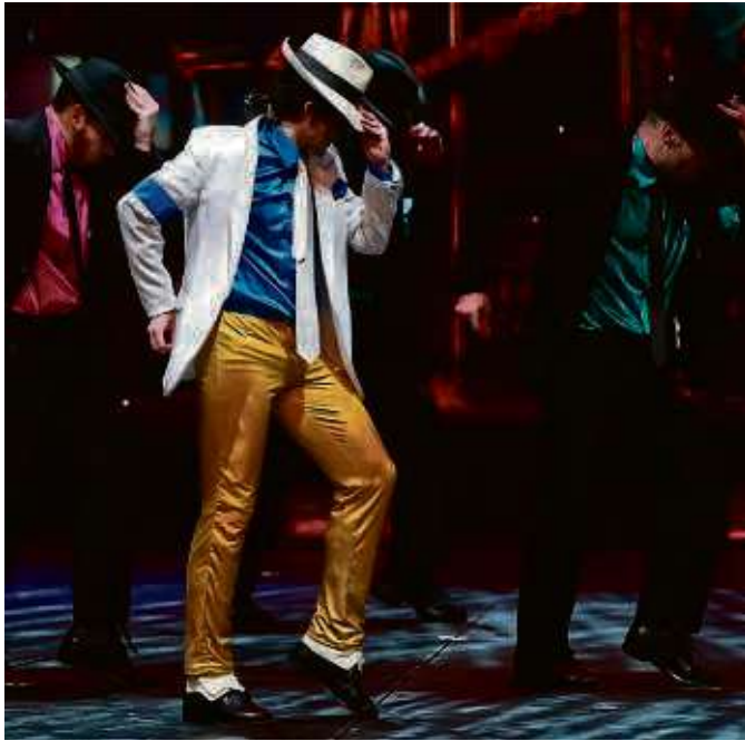
Der King of Pop steht im Mittelpunkt des Tribute-Konzerts in Frankfurt.

Hanau – Es ist wenig erstaunlich, dass Fans von Musikgrößen so gerne auf Konzerte gehen. Da ist ihr Star nicht nur zum Greifen nah. Dort hören sie ihn live, spüren seine Ausstrahlung und die Stimmung im Saal, genießen die persönliche Ansprache, bekommen quasi das Gesamtpaket aufgetischt mit Show und Mitmacheinlagen fürs Publikum. Kein Wunder also, dass sich Tribute-Konzerte verstorbener Künstler so großer Beliebtheit erfreuen. Besonders dann, wenn die Coverband so gut ist, dass man sie kaum vom Original unterscheiden kann. Mit „Forever – The best Show about Michael Jackson“ bieten jetzt der HANAUER ANZEIGER und die Konzertagentur Shooter Promotions den Lesern wieder eine Konzertfahrt nach Frankfurt, die ein solches Erlebnis verspricht: Am Dienstag, 12. März 2024, geht es vom Verlagsgebäude an der Donaustraße