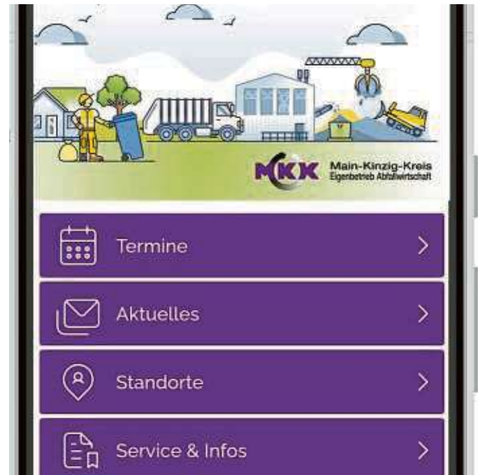
Der digitale Abfallkalender startet im Januar.

Das zweite Standbein der Digitalisierung bildet ein Webmodul auf der Homepage der teilnehmenden Kommunen und des Eigenbetriebs