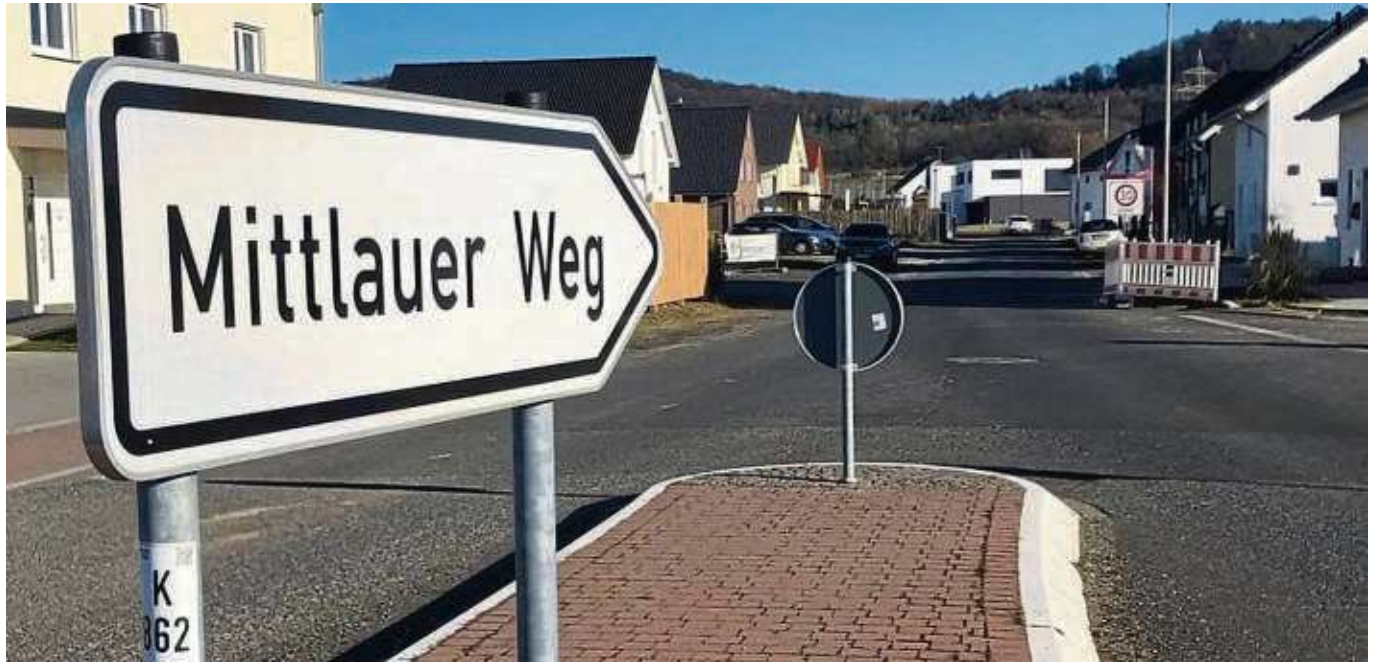
Zweifel bleiben und der Magistrat lässt nicht locker: Die Grundstücksverkäufe im „Mittlauer Weg“ in Meerholz beschäftigt weiterhin die Kommunalpolitik.

Das Grundstück soll der Bauamtsleiter laut Strafanzeige im Jahr 2015 auf einem Plan farblich so gekennzeichnet haben, dass es für andere Bewerber nicht zur Verfügung stand. Um dies zu vertuschen, soll er Ende 2019 das Grundstücksreservierungsformular, das zuvor nicht abgegeben wurde, mit einem rückdatierten Datum in die Akten eingepflegt haben. Gegen den ehemaligen Bauamtsleiter bestand somit der Verdacht der Falschbeurkundung, Verleitung von Untergebenen zu einer Straftat sowie der Urkundenfälschung, gegen Sohn und Schwiegertochter wurde ebenfalls wegen Urkundenfälschung ermittelt.