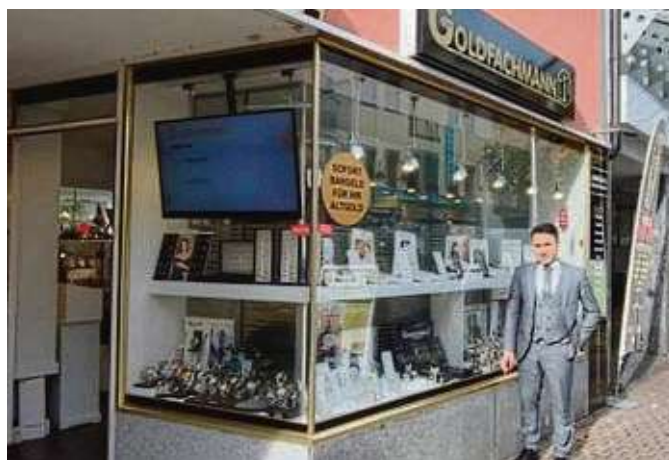
Der Goldfachmann rät: Jetzt noch schnell Gold in Bargeld tauschen und für Weihnachtsgeschenke nutzen.

Es ist erwähnenswert, dass der Wert von Gold kontinuierlich steigt.