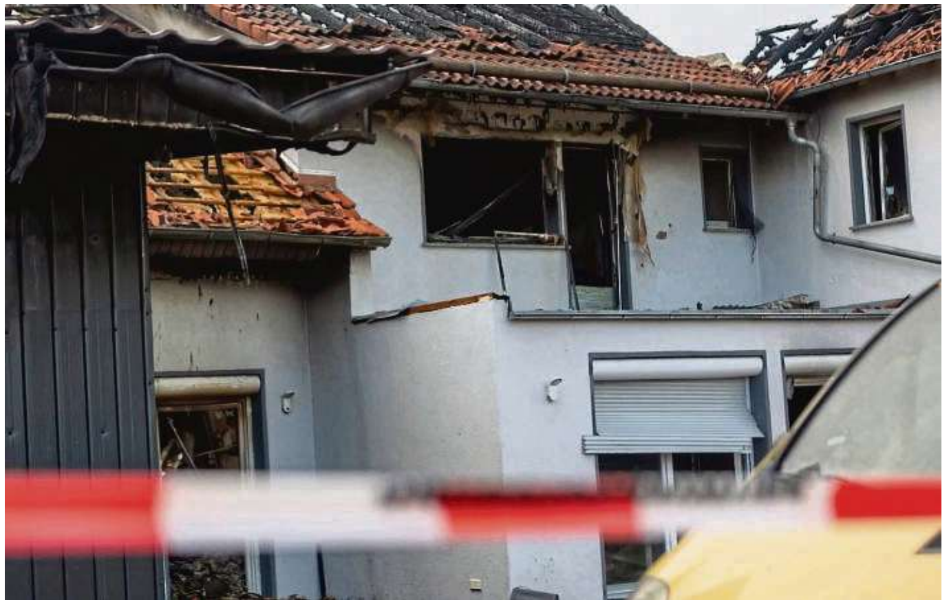
Raub der Flammen: Das Feuer hat das Wohnhaus in Wittgenborn zerstört. Die Polizei ermittelt nun wegen schwerer Brandstiftung.

In dem Haus habe eine Familie aus Pakistan gelebt. Der Brand ereignete sich im privaten Wohnhaus einer Familie, „die vor vielen Jahren aus Pakistan einreiste. Sie lebten seit vielen Jahren integriert in Wittgenborn. Aktuell ist die Familie bei