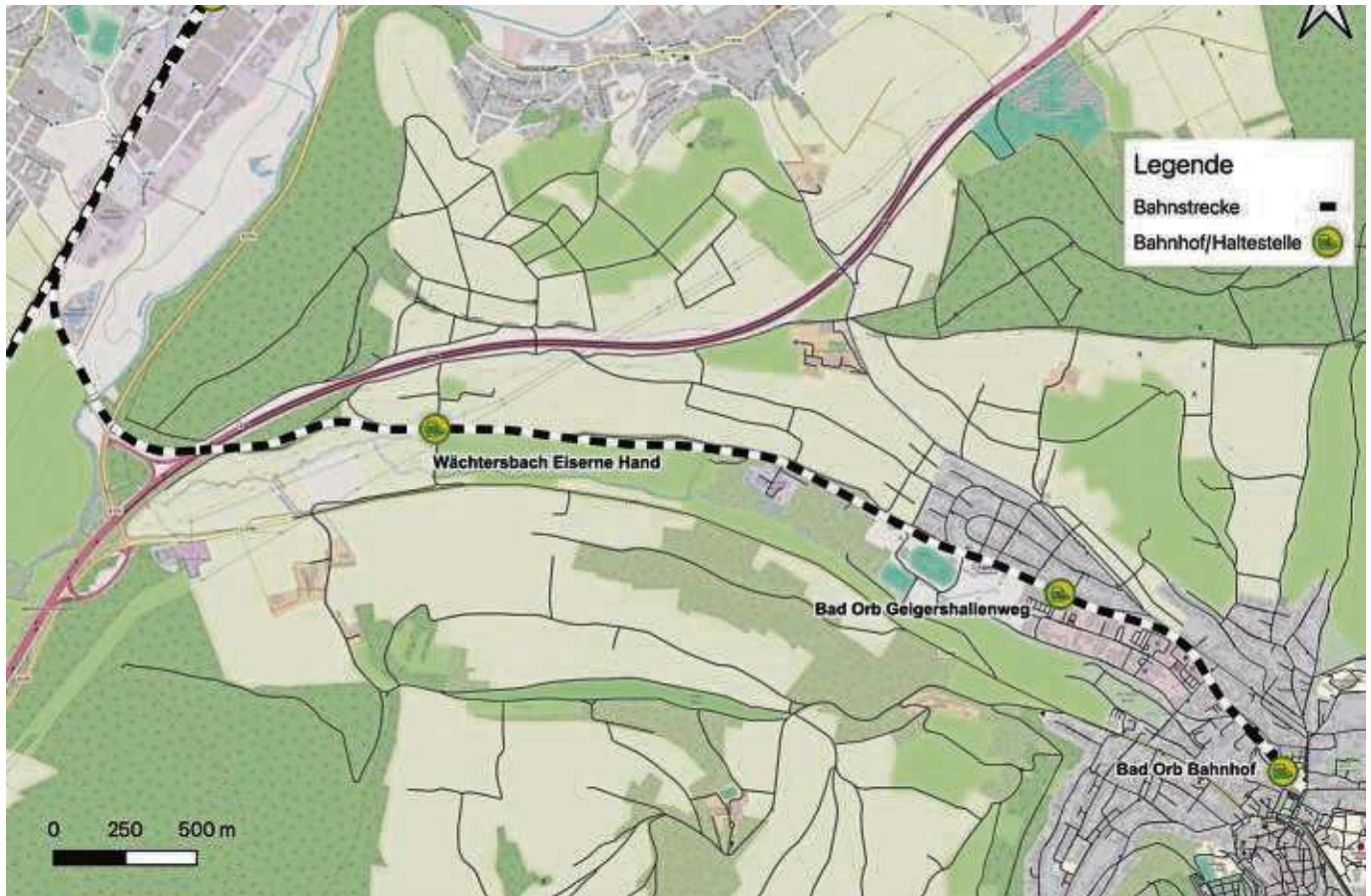
Laut der Machbarkeitsstudie hat die Strecke der Elmo-Bahn von Wächtersbach – Bad Orb Potenzial für eine Reaktivierung.

Unter den Aspekten von Topografie und Streckenlänge wäre theoretisch