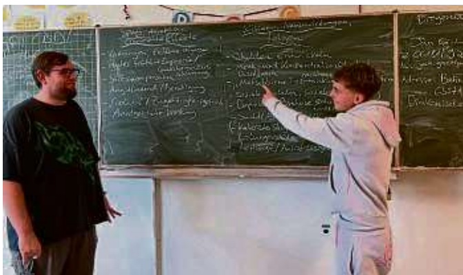
Schüler der Jahrgangsstufen sieben und neun beschäftigten sich mit dem Thema Suchtprävention.