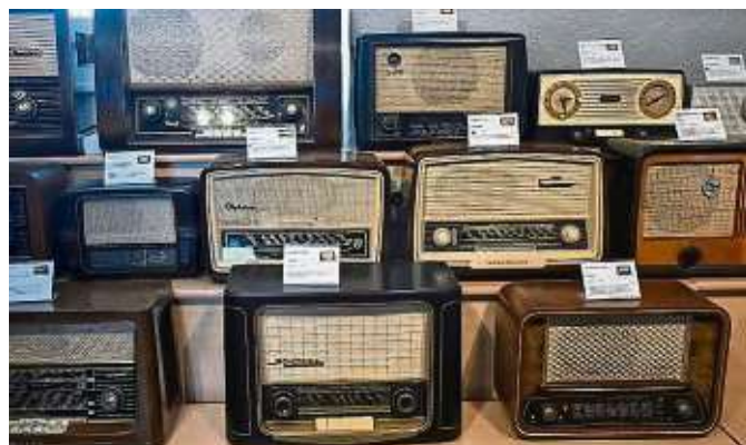
Aufwendig gearbeitet: typische Küchen- und Tischgeräte aus den 50er Jahren mit Holzgehäuse, Messingverzierung und kariertem Schallwandstoff.

Weitere Informationen auch im Internet unter www.radio-museum.de .