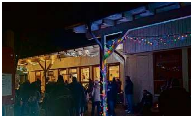
Die Kita Eulennest in Lieblos hat kürzlich erfolgreich ihren ersten Adventsmarkt veranstaltet.