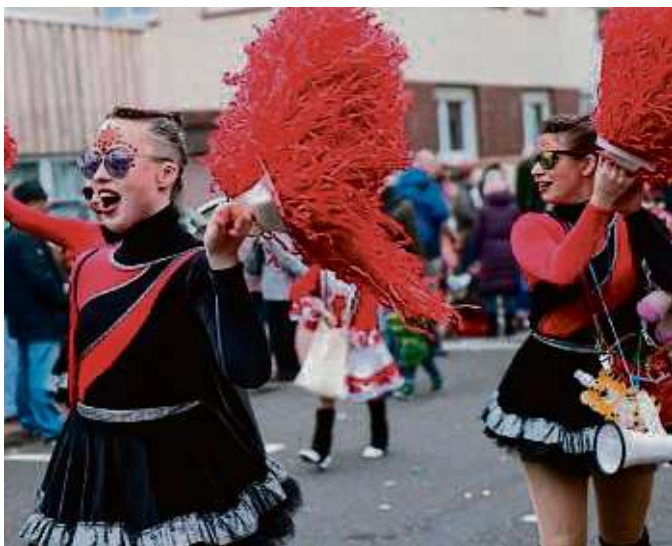
Am 10. Februar schlängelt sich der Faschingsumzug durch Gelnhausen. Fußgruppen (wie auf dem Foto eine Gruppe der Haileurer Heilichköppchen) und Motivwagen sollten sich jetzt anmelden.

ckenführung und Logistik des vergangenen Jahres aufgenommen und wollen auch dem Wunsch der Bürgerinnen und Bürger nach einem festen Endpunkt des Umzuges nachkommen. Es wird zwar keine große Abschlussveranstaltung, aber die Möglichkeit zum gemütlichen Beisammensein geben“, fasst Bürgermeister Christian Litzinger die wesentlichen Änderungen beim Faschingsumzug 2024 zusammen. „Der Umzug startet wieder am Kreis Ostspange, begeistert dann die Narrenschar entlang der Ortsdurchfahrt (Barbarossastraße, Berliner Straße), biegt aber diesmal an der Stadthalle in die Philipp-Reis-Straße ein, setzt seinen Weg Richtung Schifftor fort und schwenkt schließlich in den Uferweg ein. Der Zug wird sich dann auf der Bleiche auflösen, wo sich die Gäste an verschiedenen Buden stärken und den närrischen Nachmittag ausklingen lassen können. Es wird auch entlang der Strecke vereinzelt Getränkestände geben, und für Toiletten ist gesorgt. Am Main-Kinzig-Forum wird eine Familienzone eingerichtet. ari