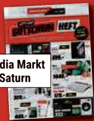
Media Markt Saturn

SIE HABEN INTERESSE, IHRE FLYER/PROSPEKTE ÜBER UNS ZU VERTEILEN? RUFEN SIE UNS AN! 06181 2903-512 BEILAGEN@HANAUER.DE