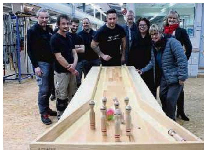
Alle Neune: Vertreter der AQA und des Kreises beim Test der Tischkegelbahn.