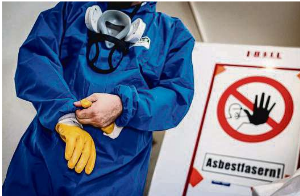
Personen, die ein asbestbelastetes Haus sanieren, brauchen dringend ausreichende Schutzkleidung. Die Fasern sind nachgewiesen krebserregend.

Er warnt vor einer „unsichtbaren Gefahr“, wenn Altbauten zu Baustellen werden: „Alles fängt mit Baustaub und dem Einatmen von