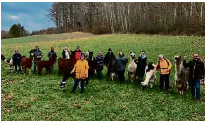
Die Kita-Leitungsteams erfuhren interessante Fakten über Alpakas und Lamas während einer Wanderung.

Die katholische Kirchengemeinde St. Peter und Paul und die Gemeinde Freigericht suchen für mehrere der insgesamt neun Freigerichter Kitas personelle Verstärkung und nehmen Bewerbungen gerne entgegen. Die jeweiligen Stellenangebote sind unter https://stpeterundpaulkitas.de/ und www.freigericht.de/politik-verwaltung/aktuelles/karriere/ zu finden. ari