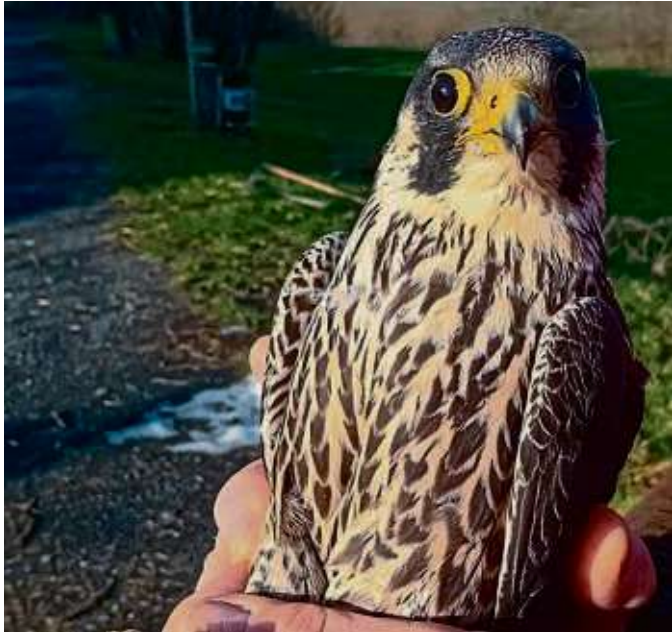
Hat die Giftattacke überlebt: Der Falke kurz vor seiner Freilassung.