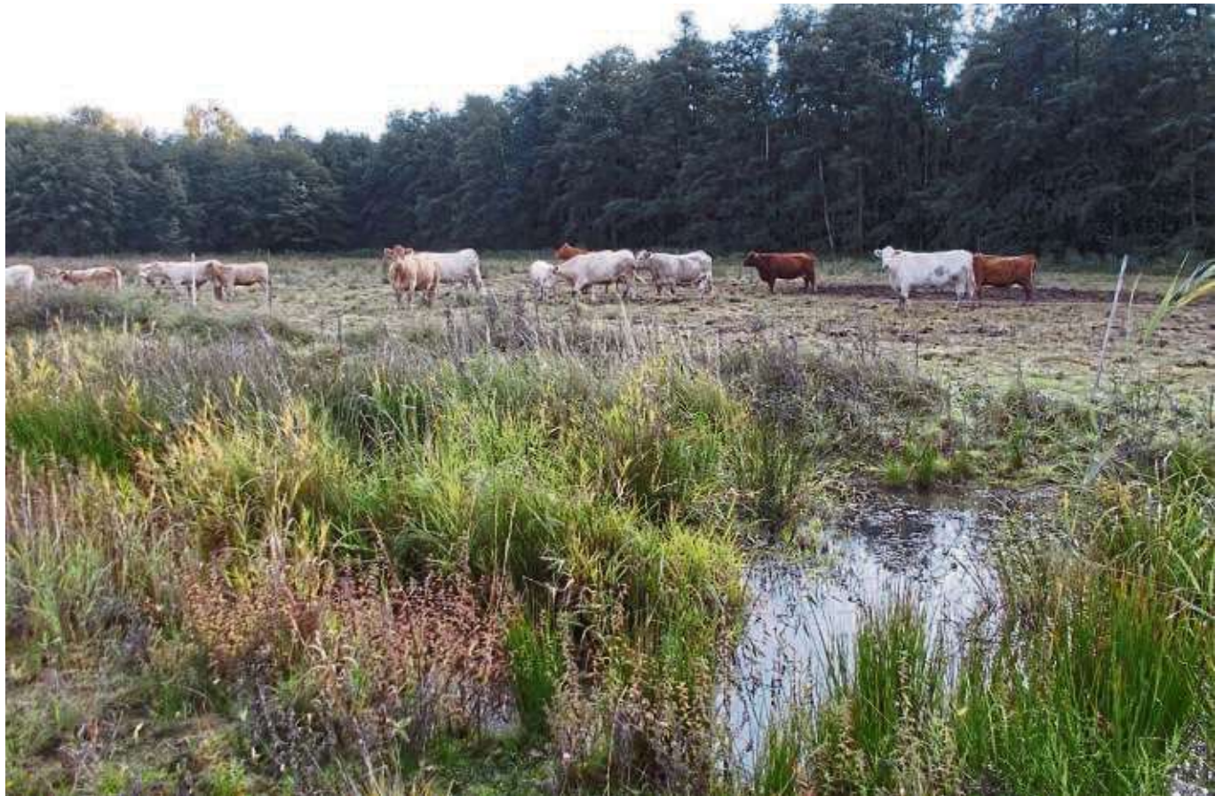
Die Instandsetzung und Neuanlage von Weidenfurten ermöglicht die Pflege von Feuchtgebieten durch Rinder und eine Erhöhung des Artenreichtums.

Ein weiterer Arbeitsschwerpunkt ist das „Konfliktfeld Ruhlsee – Vogelparadies versus Ausflugsziel“, wie die GNA betitelt. In Zusammenarbeit mit der Stadt Langenselbold errichtete die GNA einen Themenpfad, der nach über zehn Jahren jetzt erneuert werden soll. Zudem müssten vier stark beschädigte Infotafeln dringend ausgetauscht werden. Weitere Tafeln sollen die Wegeführung, Betretungsregeln