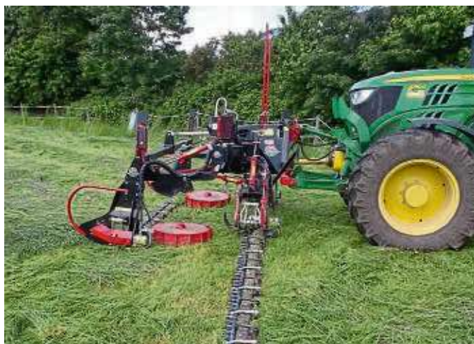
Das neue Doppelmesser-Mähwerk arbeitet insekten- und amphibienfreundlicher.

während der Brut- und Setzzeit und die Anleinplicht von Hunden erklären. „Die Besucherlenkung dient dem Schutz von Wiesenvögeln und vielen anderen Wildtieren im Naturschutzgebiet“, so Hufmann. Im vergangenen Jahr wurde zudem das Feuchtgebiet Herrenbruch weiterentwickelt, informiert die GNA. In der Niedermittlauer Kinzigau entsteht seit August auf einer bisher intensiv genutzten Wiese ein völlig neues Feuchtgebiet mit vielfältigen Lebensräumen für zahlreiche Tier- und Pflanzenarten. Nach zweijähriger Planungszeit starteten die Bauarbeiten mit der Anlage eines Ringgrabens, wodurch ein etwa drei Hektar großes Kiebitzrefugium entstand. Eine sichere „Insel“ sei für am Bo-