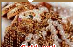
Gold- und Silberschmuck