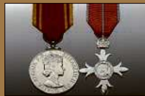
Medaillen / Orden