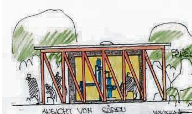
Der Entwurf für das Brunnenhaus für die neue Leopoldquelle in Bad Orb.

Bad Orb – Nach sechsmonatiger Bauphase verkündet die Bad Orb Kur GmbH den erfolgreichen Abschluss der Solebohrung zur Leopoldquelle. Damit sei der erste Bauabschnitt des „Jahrhundertprojektes“ abgeschlossen. Weil die Leitungen der drei alten Heilquellen Bad Orbs in die Jahre gekommen sind und die Sanierung nicht mehr lohnt, hatte die Kurstadt nach Alternativen gesucht. Ein von der Kurstadt beauftragter Hydrologe hatte die unterirdische Sole-Ader entdeckt, die ihren Ursprung im Kaliberg bei Flieden hat. Die Bohrungen hatten im September 2023 begonnen. Nach einer neunwöchigen, intensiven und schwierigen Bohrzeit stieß man in einer Tiefe von 100 Metern auf die Solequelle, die „Leopoldquelle“. „Diese Quelle stellt eine bedeutende Sicherung des Gesundheitsstandortes mit seinem natürlichen