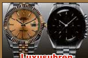
Luxusuhren aller Art