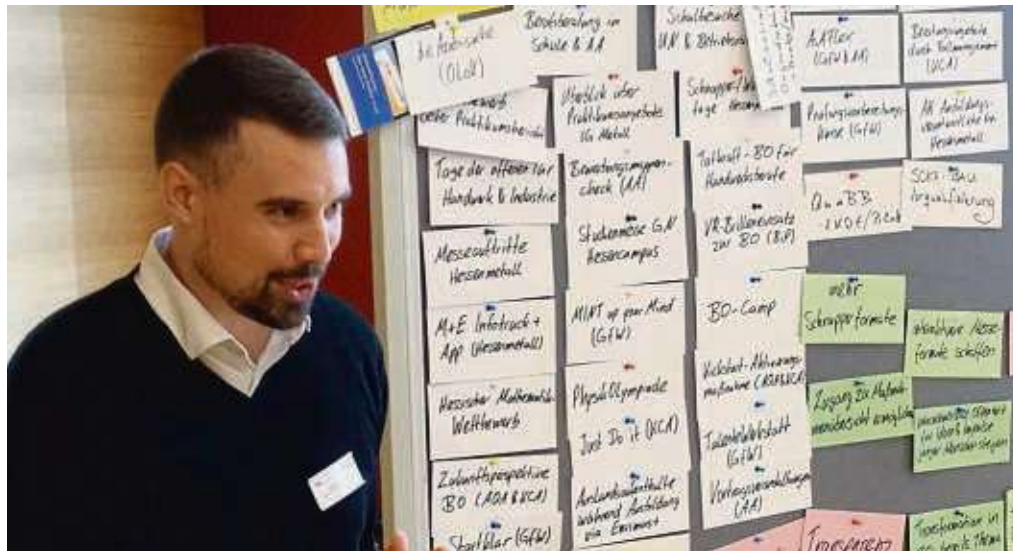
Der Prozess zur Transformation der Arbeitswelt wird begleitet durch Mitarbeiter des Instituts für Wirtschaft, Arbeit und Kultur (IWAK) der Goethe-Universität Frankfurt.

Die Fäden laufen vor Ort in einer regionalen Steuerungsgruppe zusammen, die die regionale Lage analysiert und Umsetzungsaktivitäten entwickelt. Der Steuerungsgruppe gehören Vertreter der Kammern,