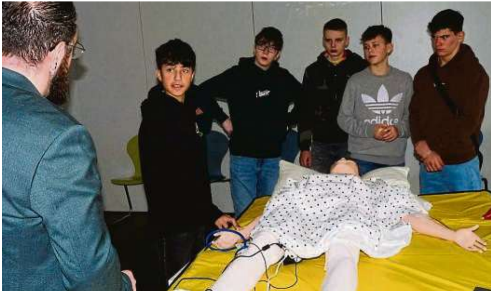
An der Puppe „Nursing Anne“ üben Schüler den Puls zu fühlen – und den Wert auch gleich richtig einzuordnen.

„Macht die Puppe Geräusche?“ fragt ein Junge. „Richtig erkannt“, bestätigt Baulig, „sie atmet schnell und wenn es ein Mensch wäre, wür-