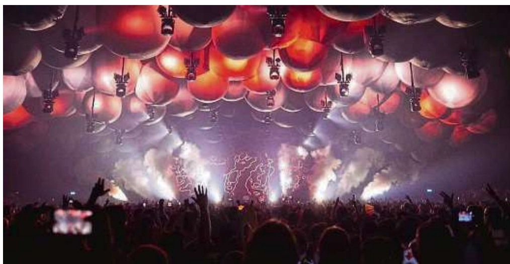
Die Time Warp verbindet visuelle Effekte mit dem Nonplusultra der elektronischen Musik – und das seit 30 Jahren.

Tickets und Infos zum Programm gibt's online auf time-warp.de . ari