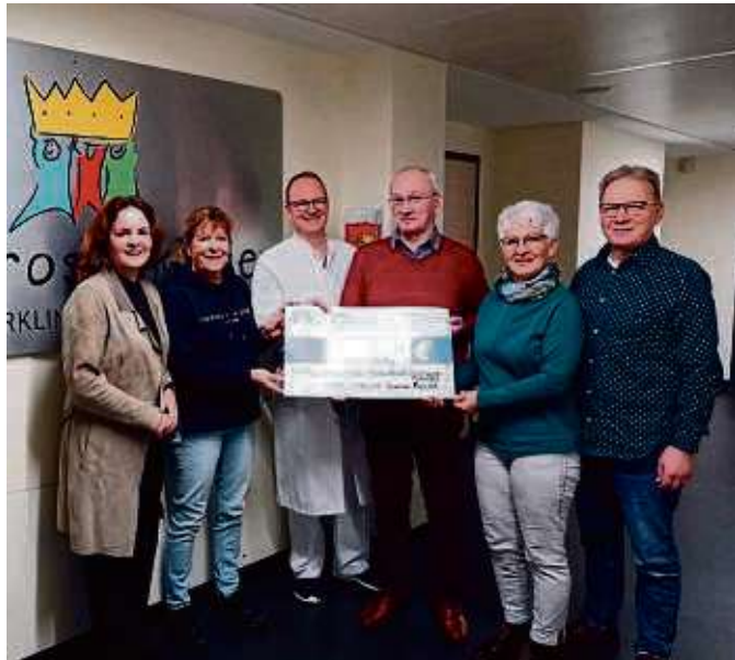
Der ehemaliger Fanclub der Tanzkapelle Tornado spendete einen Betrag von 750 Euro an den Förderverein Barbarossakinder.