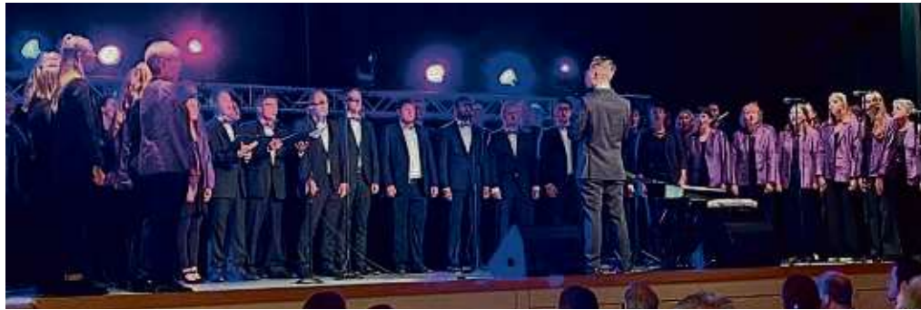
Mit 80 Aktiven und karibischen Klängen ins neue Jahr: Der Chor „belcanto“ aus Linsengericht freut sich auf ein besonderes Konzerthighlight.

Die fast 30-jährige Kooperation mit den Chören der Kopernikusschule Freigericht, für die „belcanto“ be-