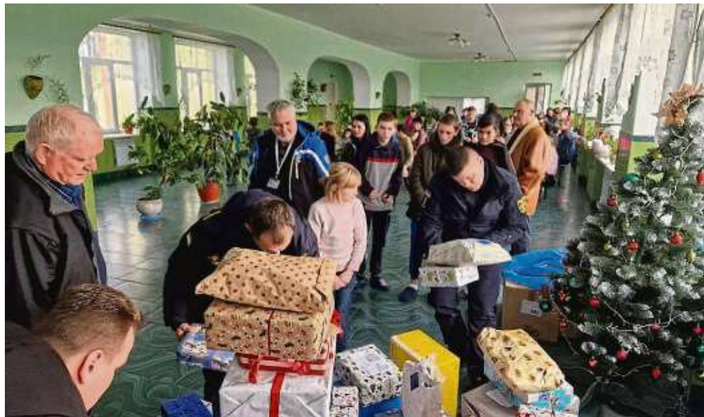
500 Weihnachtspäckchen umfasste der Hilfstransport, den die Reservistenkameradschaft Hanau nach Lemberg in die Ukraine brachte.

Gleichwohl der 50-Jährige bei allen Touren dabei war, beschreibt er die Situation an der polnisch-ukraini-