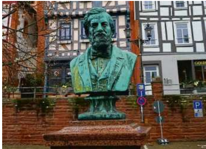
Die Büste von Philipp Reis steht auf dem Untermarkt in seiner Geburtsstadt Gelnhausen.

Am 7. Januar 1834 kam Philipp Reis an der Langgasse in Gelnhausen zur Welt. Am Geburtshaus erinnert eine Tafel und im Ortskern eine Büste an den nach Grimmelshausen („Simplicissimus“) wohl bedeutendsten Gelnhäuser. Nur rund zehn Jahre lebte Philipp Reis in der Barbarossastadt. Die Mutter starb bereits ein Jahr nach seiner Geburt, der Vater,